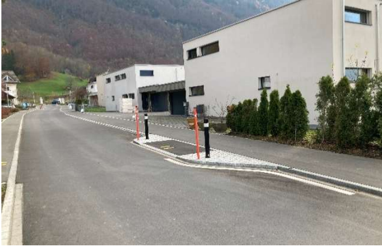
Abbildung 5: bestehender Horizontalversatz Gebiet "Chastli" in Schänis