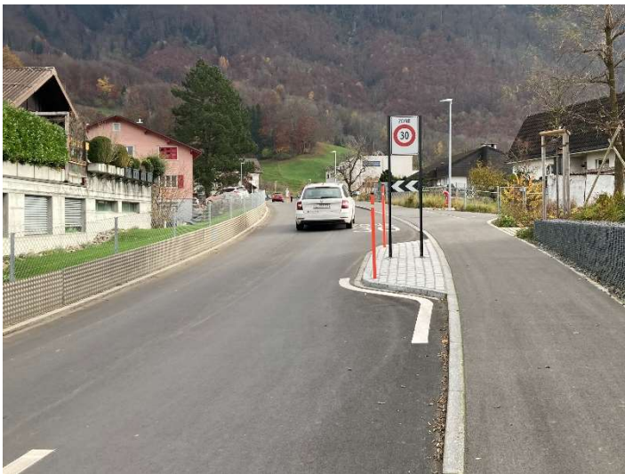
Abbildung 3: bestehender Zoneneingang Gebiet "Chastli" in Schänis

Ob in der geplanten Tempo-30-Zone in Zukunft Radarkästen aufgestellt werden, muss die zuständige Polizei entscheiden. Grundsätzlich soll die Einführung von Tempo-30-Zonen so gestaltet werden, dass auf Radargeräte verzichtet werden kann und die Geschwindigkeiten mit den getroffenen Massnahmen entsprechend eingehalten werden. Aus verkehrstechnischer Sicht wird ein Jahr nach Einführung von Tempo 30 im Rahmen einer Wirksamkeitsprüfung Geschwindigkeitsmessungen durchgeführt. Falls sich herausstellt, dass das gemessene Geschwindigkeitsniveau einer Tempo-30-Zone nicht gerecht wird, sind zusätzliche geschwindigkeitsreduzierende Massnahmen erforderlich. Diese sind im Massnahmenplan Orange dargestellt.