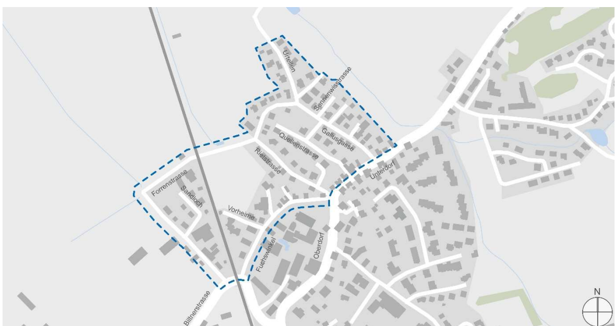
Abbildung 1: Bearbeitungsperimeter

Im Zusammenhang mit der Umsetzung der Tempo 30 Zone bekam die Öffentlichkeit die Gelegenheit zur Mitwirkung im Projekt. Es sind 10 Stellungnahmen eingegangen welche nachfolgend beantwortet werden.