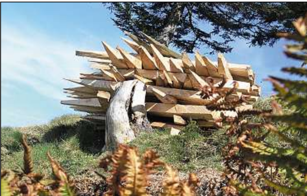
Der nächste Sommer kommt bestimmt