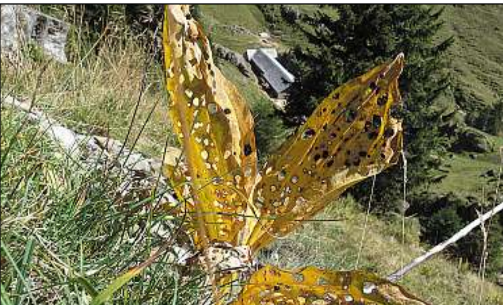
Alp Trübsiten in den letzten Zügen des Alpsommers 2006