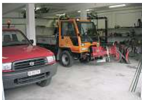
Die neuen Räumlichkeiten des Werkdienstes.

EVS-Werkgebäude abschliessen. Das bis anhin darin betriebene Magazin des Netunterhaltes konnte in das Untergeschoss des Werkgebäudes verlegt werden. Als indirekte Folge des Hochwasserereignisses vom 17. September 2006 verzögerte sich der ursprünglich auf September geplante Umzug allerdings um kurze Zeit. Mittlerweile wurden die neuen Räume jedoch vom Werkdienst bezogen und die Gerätschaften gezügelt. So konnte beispielsweise auch rechtzeitig auf den Winter die Kranbahn zur Montage des Salzstreuers auf den Kommunalfahrzeugen installiert werden. Übrigens: Kranbahn, Werkbank, diverse Werkzeuge und Aufhängevorrichtungen wurden aus dem «Nachlass» der abgebrochenen ARA Schänis übernommen. Bereits konnte das Team des Werkdienstes erste positive Erfahrungen im neuen Werkgebäude sammeln: Die grosszügigeren Platzverhältnisse ermöglichen eine Optimierung der betrieblichen Abläufe. Die Redaktion von Schänis aktuell wünscht den Mitarbeitern des Werkdienstes eine unfallfreie Winterzeit.