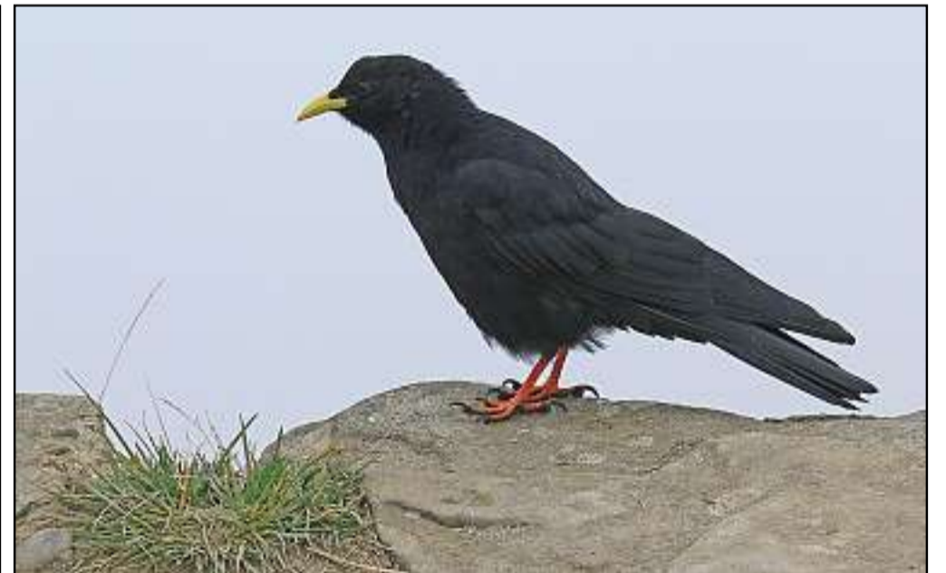
Noch ist die harte Zeit des Winters auf dem Speer nicht angebrochen