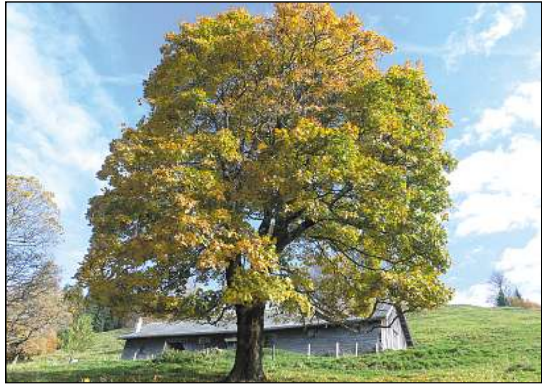
Herbstidylle bei der unteren Steinegg