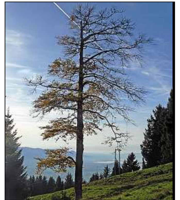
Herbststimmung im Bogmengebiet