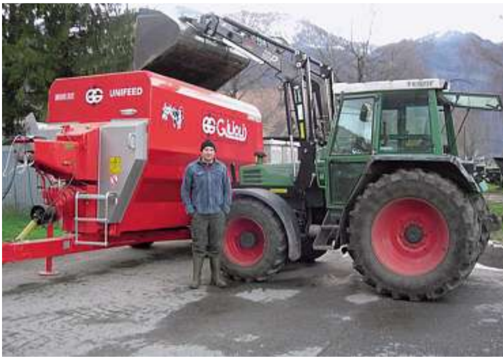
Simon Büchler mit Schredderwagen.