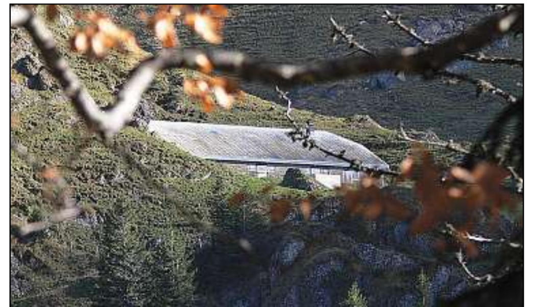
Die Sonnenstrahlen werden immer seltener bei der oberen Bätrens