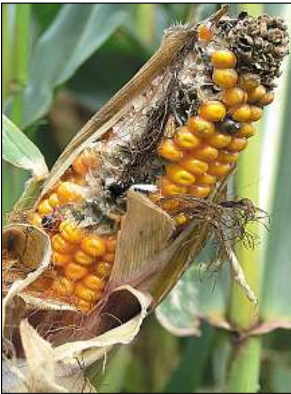
Herbstzeit ist Erntezeit – und die Vögel helfen mit