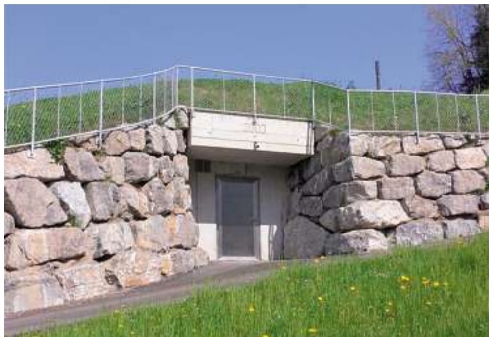
Eingang zum neuen Reservoir Chrummen

Wichtige Informationen und der Veranstaltungskalender werden auf der Maseltranger Homepage dauernd aktualisiert. Überzeugen Sie sich selber - und surfen Sie auf der Internetseite von www.maseltrangen.ch . Sie werden staunen.