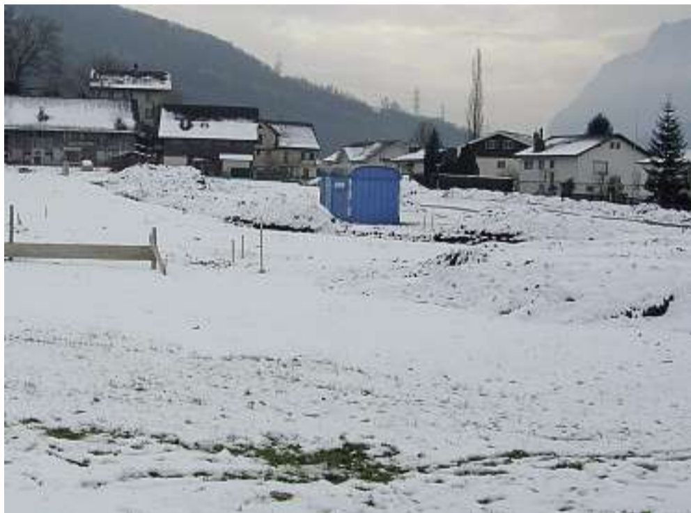
Die sich im Bau befindende Graf-Hunfried-Strasse erschliesst zirka 20 Parzellen für Einfamilienhäuser.

Kaiser Karl dem Grossen durfte er dabei ein edelsteinbesetztes Goldkreuz mit einem Kreuzpartikel und ein Onyxgefäss mit heiligem Blut Christi entgegennehmen. Als Belohnung für die überstandenen Strapazen der Gesandtschaftsreise erbat sich Hunfried von Karl dem Grossen die Reliquien, zu deren Verehrung er ein Kloster zu bauen gelobte. Nach dem Tode Karls des Grossen im Jahre 814 löste Hunfried sein Gelübde ein und gründete zu Ehren des heiligen Kreuzes und Blutes Christi ein Kloster (heutiges Kreuzstift) an einem Ort der «Skennines» genannt wurde. Im Jahre 828 stand das Kloster. Der Stifter hatte das Recht, erster Schirm- und Kastvogt über Schänis zu sein. Die Erben Graf Hunfrieds, die «Edlen von Schänis», waren von 833 bis 1018 in Schänis Kastvögte. Sie wohnten bis Anfang des 11. Jahrhunderts auf dem Chastli.