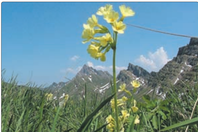
Hohe Schlüsselblume beim Rautifaad