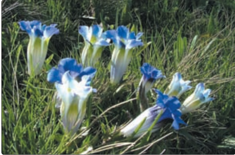
Stängelloser Enzian – seltene Ausgabe – im Bogmengenbiet