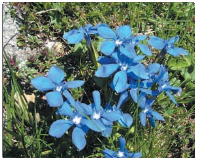
Frühlingsenzian – Bätrunstal