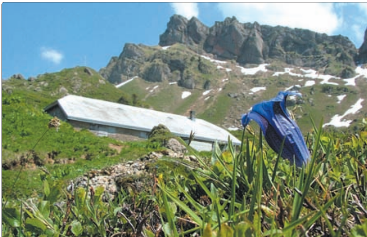
Stängelloser Enzian – im Hintergrund obere Bätruns mit Schafberg