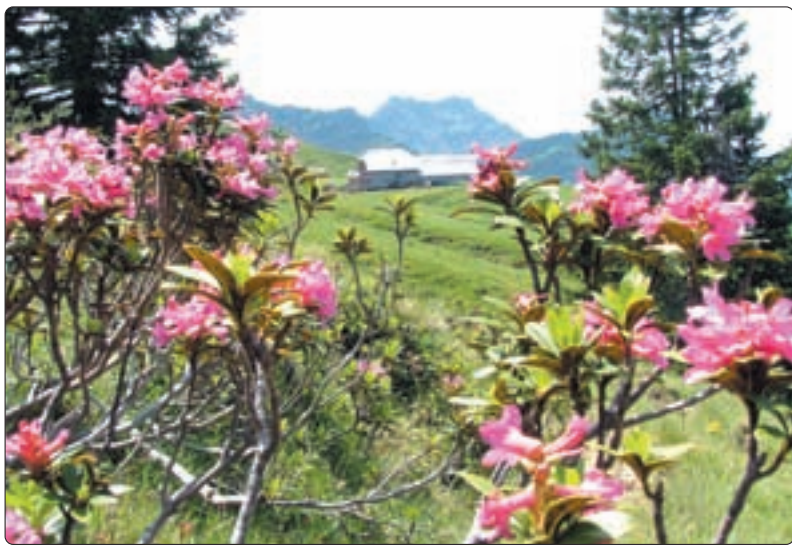
Alpenrosen – im Hintergrund die obere «Rossalp»