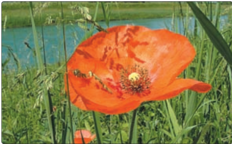
Mohn – am Linthdamm