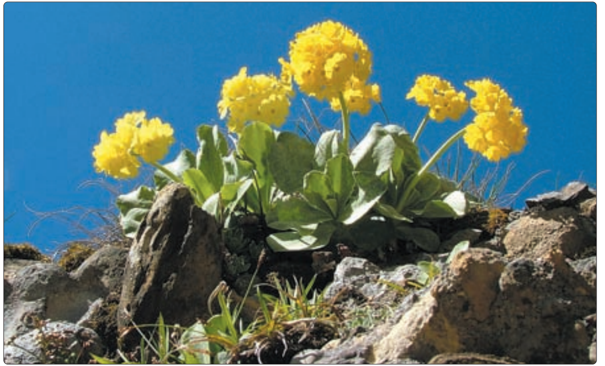
Fluh- oder Florblüemli – kurz vor der oberen Bogmen