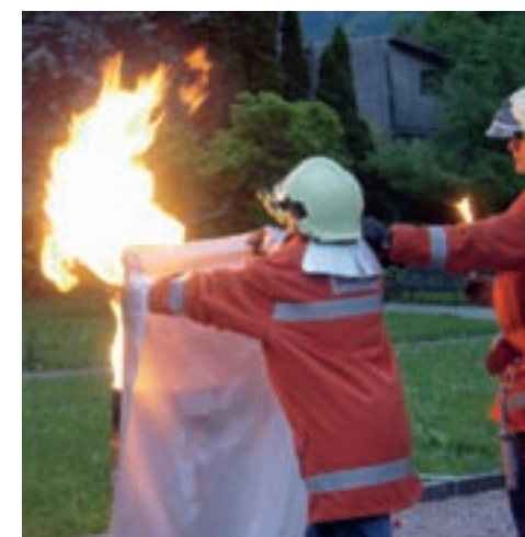
Unser Bild zeigt wie die Feuerwehr dem Betreuungsteam zeigt, wie man mit der Löschdecke umgeht.

Zusammen mit der Feuerwehr Schänis werden jährlich Sicherheits-Einrichtungen mit dem entsprechenden Vorgehen, wie Löschen mit Löschdecken, Alarmorganisation und das Bedienen der Brandmeldeanlage intensiv in Theorie und Praxis geschult. Ein besonderes Augenmerk wird dabei auf die neuen Mitarbeiterinnen und Mitarbeiter gelegt.