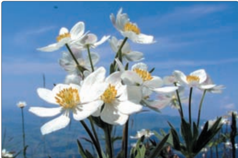
Anemonen blühen auf dem Chüemettler