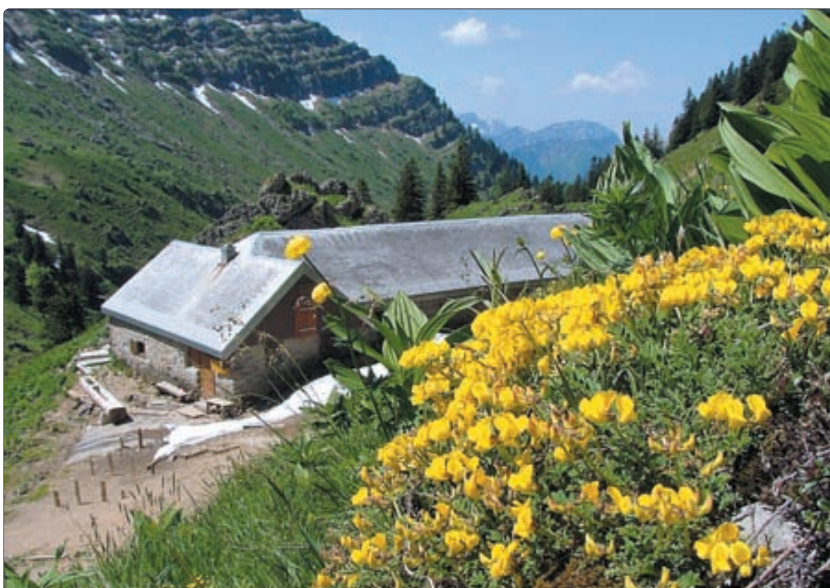
Hornklee und Trollblumen – vor der Trübsitenhütte