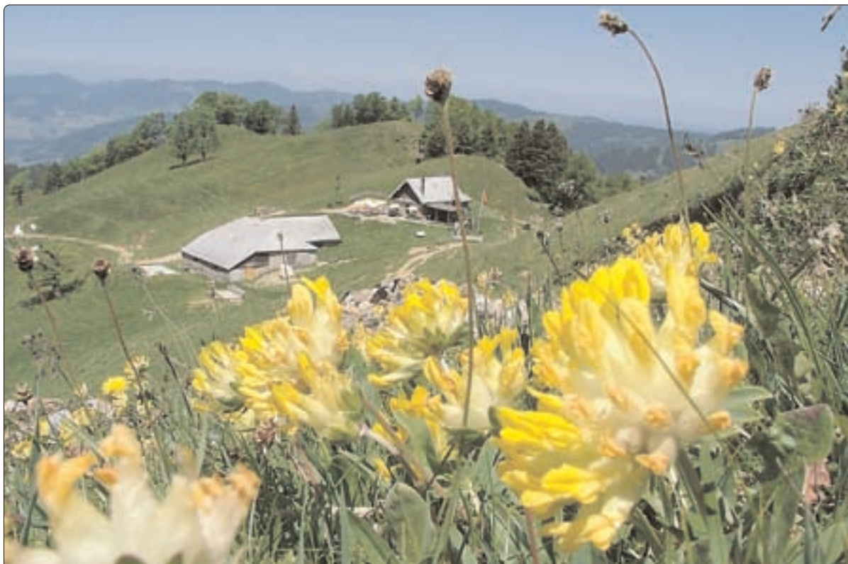
Wundklee – kurz vor der oberen Bogmen