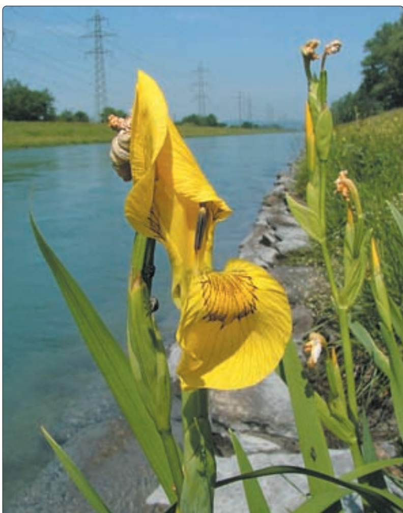
Sumpfschwertlilie an der Linth