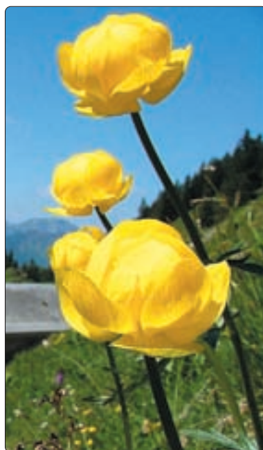
Trollblumen – Bätrunstal