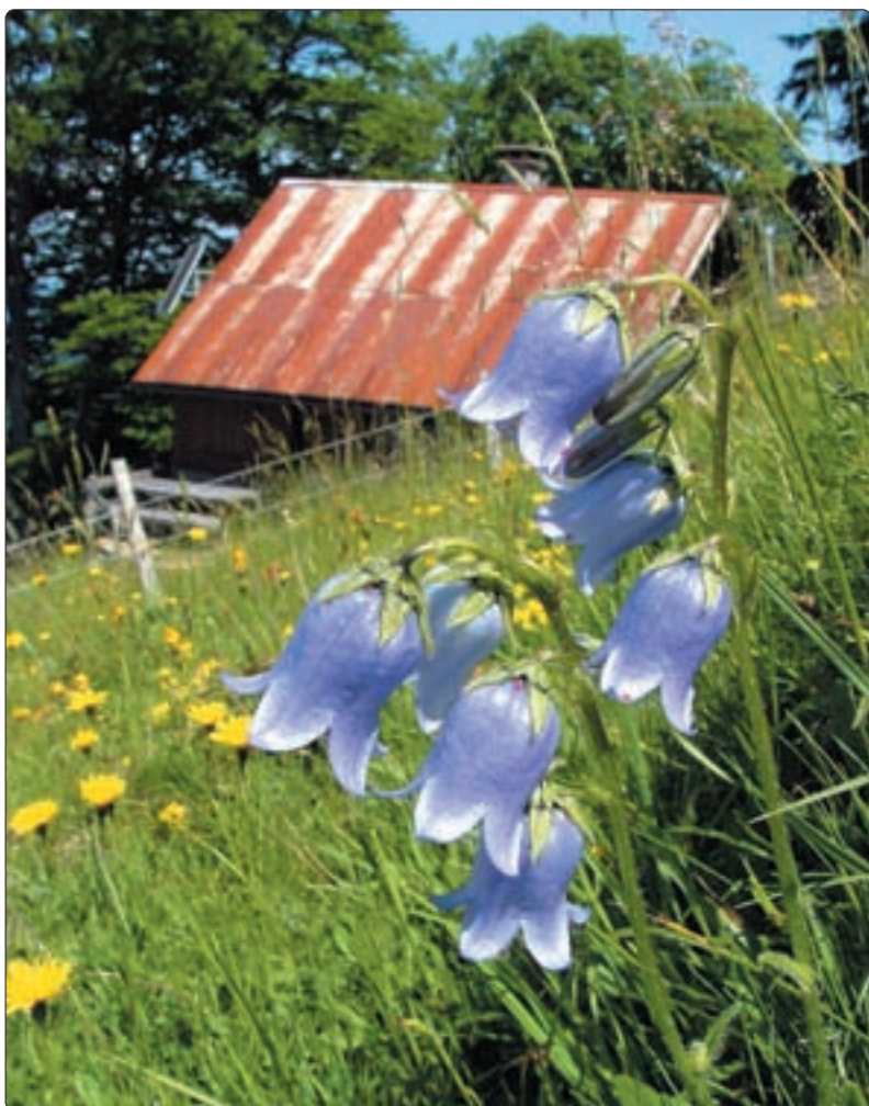
Glockenblume – im Hintergrund die Alp obere Stöck