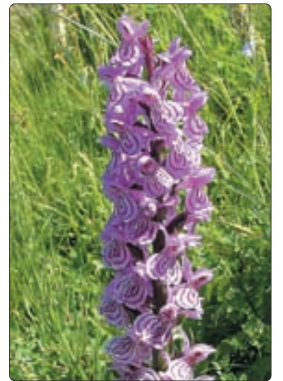
Knabenkraut – untere Bogmen