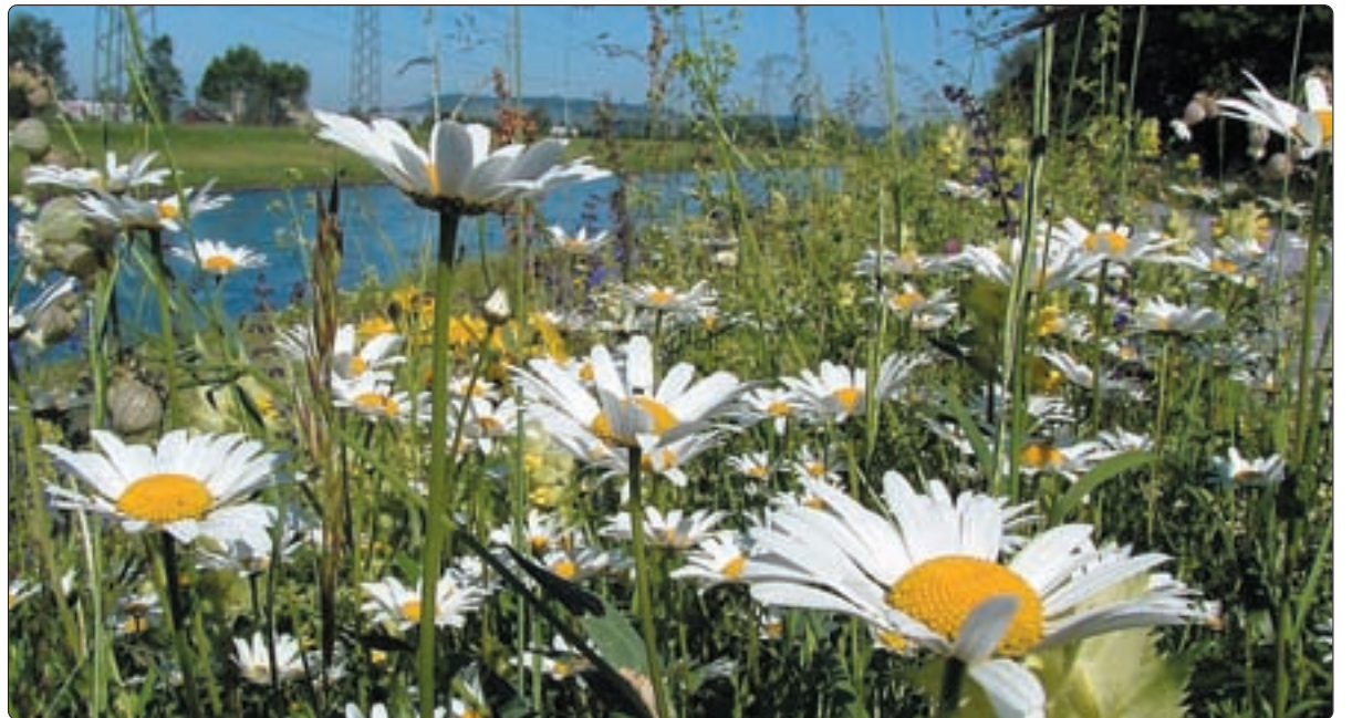
Blumenwiese beim Linthdamm