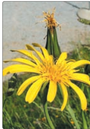
Arnika – Federhütte