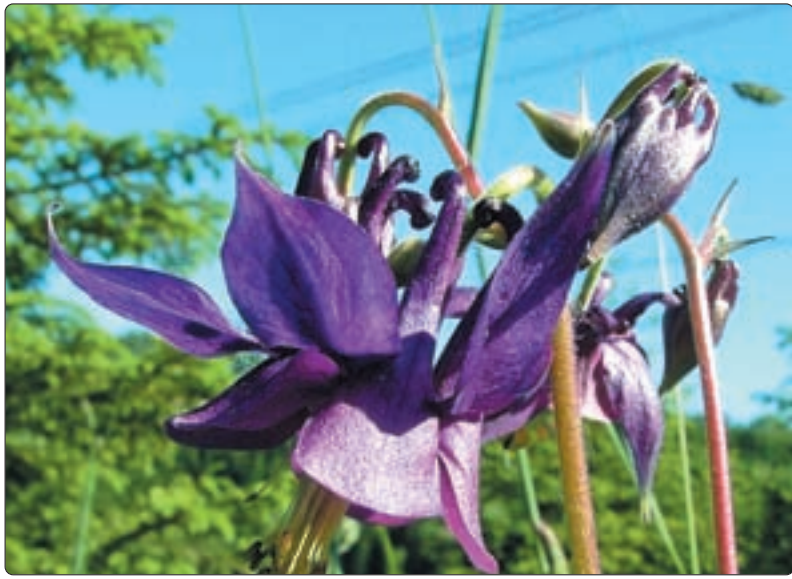
Gewöhnliche Akelei – an der Linth